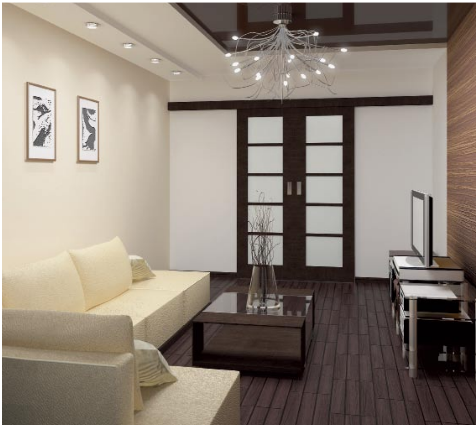
ВОСТОЧНЫЙ УЮТ. Гостиная – это полноценная зона отдыха с мягким уютным светлым диваном на фоне схожего цвета фактурных текстильных обоев.

зоне потолок по-своему оригинален) и «разбросанные» японские иероглифы. Одной из дизайнерских находок Кристины стало освещение. Практически во всех зонах оно комбинированное, что позволяет видоизменять интерьер в соответствии с настроением и ситуацией.