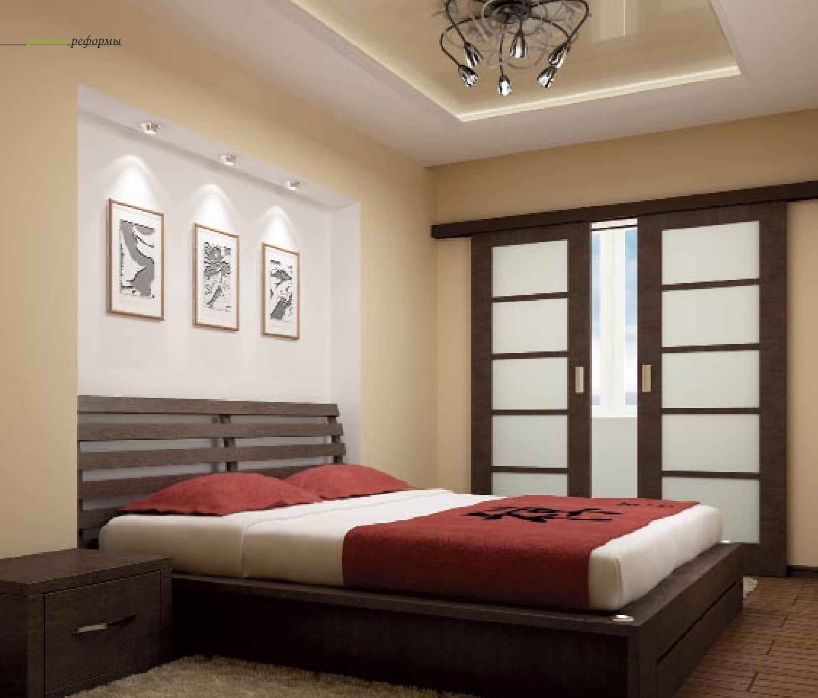
ГАРМОНИЯ В ДЕЛЕ. Деревянное изголовье кровати по фактуре и цвету сочетается с раздвижными стеклянными дверями с характерным секционным делением.

сценарий освещения в зависимости от настроения и ситуации. Очень удобно то, что к гостиной примыкает небольшой балкон. Это позволяет хорошо проветривать помещение при большом скоплении гостей, балкон также удобен для курильщиков.